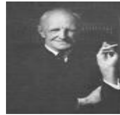
"Holding" Donald Winnicott