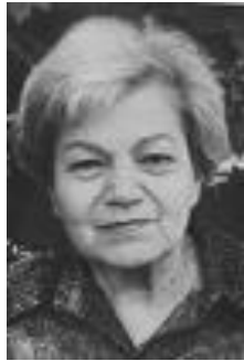
"Extra-uterine matrix" Margareth Mahler