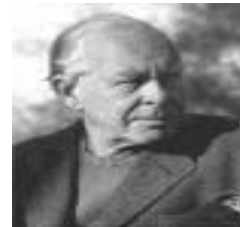
"Apego" John Bowlby