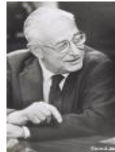
"Primary love" Michael Balint