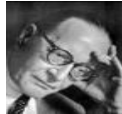
"The average expectable environment" Heinz Hartmann