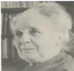
"Relação mãe-bebê" Melaine Klein