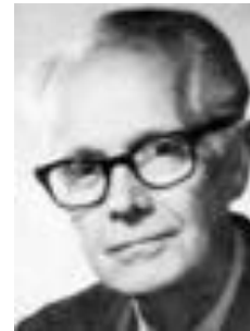
"Relação self-objetal" Heinz Kohut