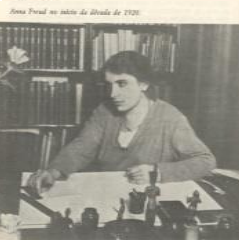
"The need-satisfying object" Anna Freud