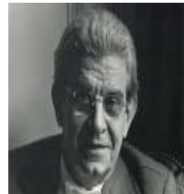
"Relação especular" "Função paterna" Jacques Lacan