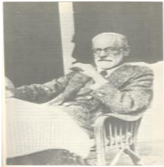
"Relação narcísica" S. Freud