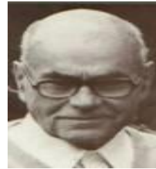
"Rêverie" W.R. Bion